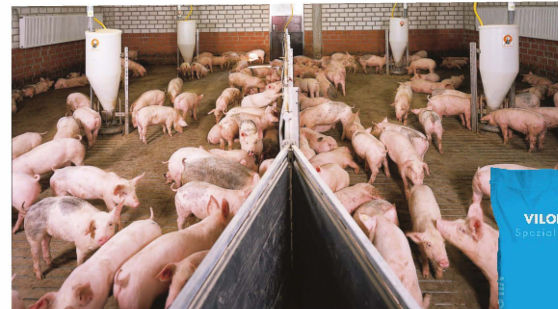
Mit VILOFOSS Vital gefütterte Ferkel zeigen ein hohes Leistungspotential.